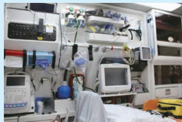
救急車には心電図を取って搬送先の病院に送信できる機器も