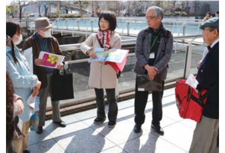
仲間と現地を歩き、ガイドコースを作り上げます

申込み 9月19日(水)までに電話、FAX、Eメール(ni-gakushu@city.yokohama.jp)、 または窓口(区役所4階48番)にて氏名・年齢・住所・電話番号を連絡