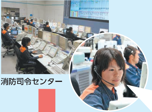
消防司令センター

119番通報 ~携帯電話からの通報でも大丈夫 次のことをあわてずに伝えてください