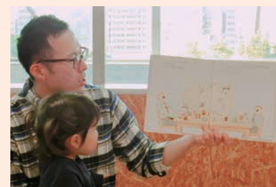
パパが読んでくれる絵本に夢中

☎9月29日、平成31年1月19日(土) 10時30分～11時30分 ①未就学児とパパ 各8組 ③受付中 西区地域子育て支援拠点スマイル・ポート(みなとみらい3-3-1 三菱重工横浜ビル3階)に直接来館または電話 ④西区地域子育て支援拠点スマイル・ポート ☎264-4355 ☎264-4350