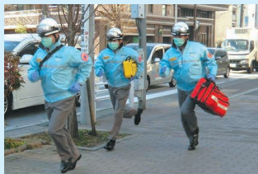
応急処置セットの入ったリュックを担いで駆け付けます