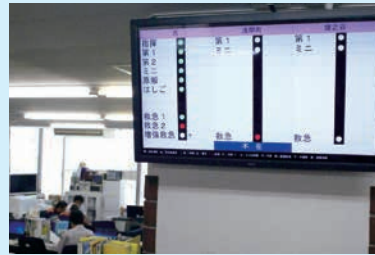
通報が入ったら、放送で出場指令が流れます